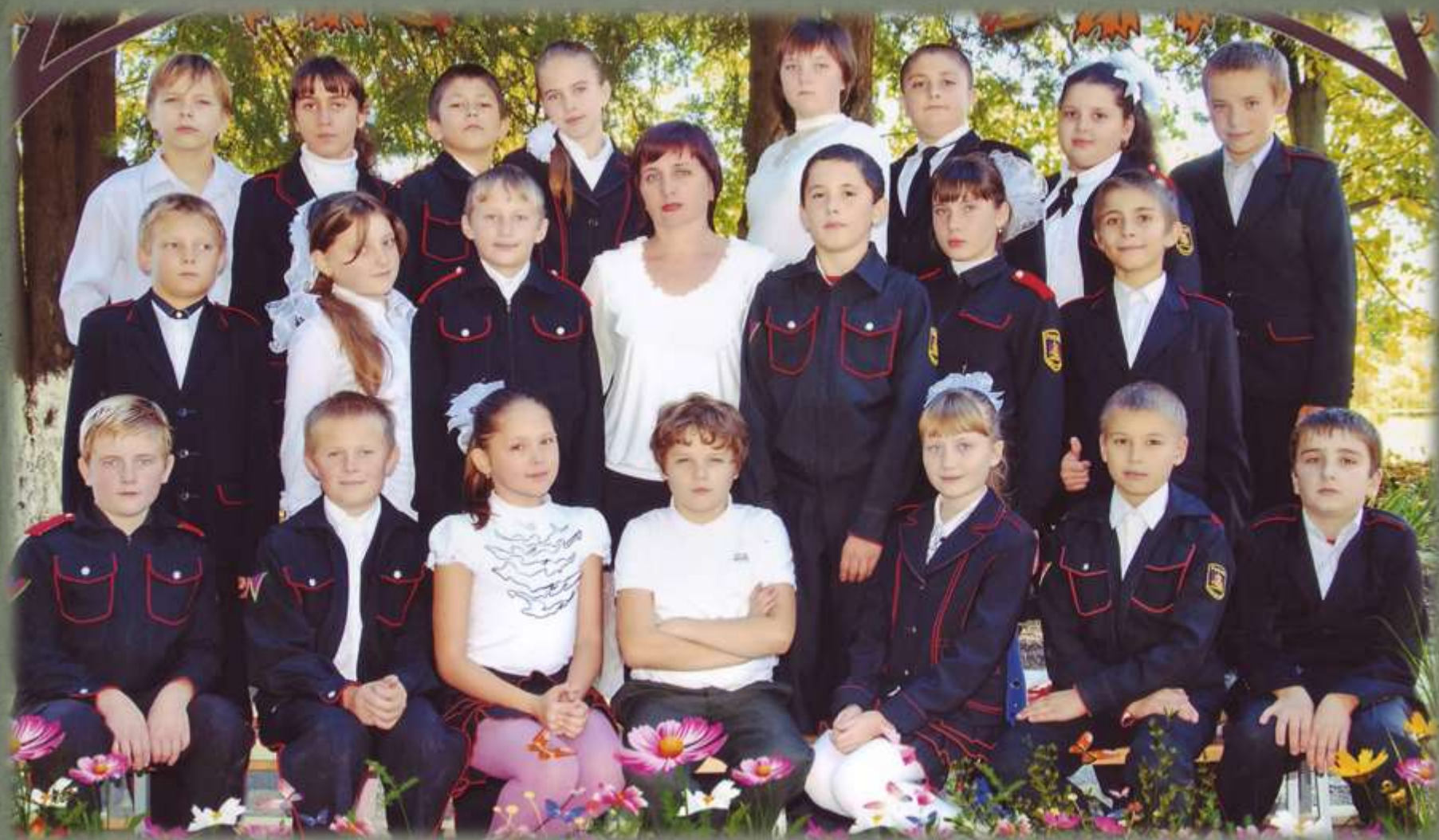
Наш дружный 6 «А» класс